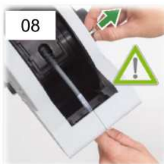
08 Guidare il cavo all'interno del MTPReel-O™ e chiudere con i carter di protezione !