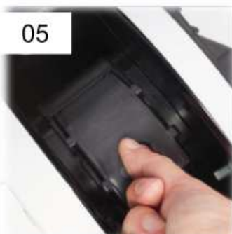
05 Chiudere lo sportello del tamburo