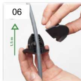
06 Chiudere la pallina fermacavo