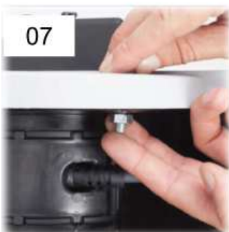
07 Sbloccare la sicurezza