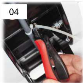
04 Fermare il cavo con una fascetta