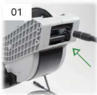
01 Inserire il cavo come indicato