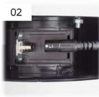
02 Connettere il cablaggio